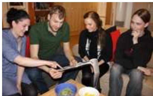
Ungdomsteamet. Projektet, som fått stor uppmärksamhet bl.a. i media, riktade sig från början till alla ungdomar i Haninge som behövde stöd. Bilden är tagen under denna första fas.

Enligt en skrift från Temagruppen för unga i arbetslivet (2011:1) är den grupp unga som brukar betraktas som "utanför" nu större än någonsin (2008: 100 000 personer). Oroande är också att ca 30 procent av ungdomarna såvitt känt inte deltar i någon aktivitet som erbjuds i samhället. Dessutom har kommunernas uppföljningsansvar för unga mellan 16 och 20 år stora brister, samtidigt som Arbetsförmedlingen har få insatser för målgruppen. För att motverka utvecklingen är det nödvändigt att myndigheterna arbetar mer över sektorsgränserna och bildar nätverk. Samordningsförbunden har många goda exempel på hur myndigheter kan samarbeta kring ungdomar och bilda sådana nätverk.