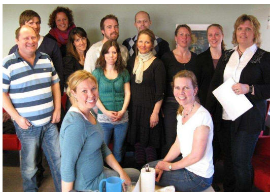
Paraplyprojektet. En glad samverkansgrupp, 2010.