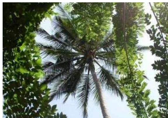
Akse. Man kanske inte kan nå stjärnorna, men med stöd är det alltid möjligt att försöka nå trädtoppen!